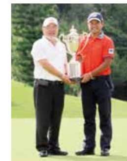
第85回日本プロゴルフ選手権大会 日清カップヌードル杯 開催