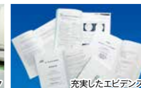
充実したエビデンス