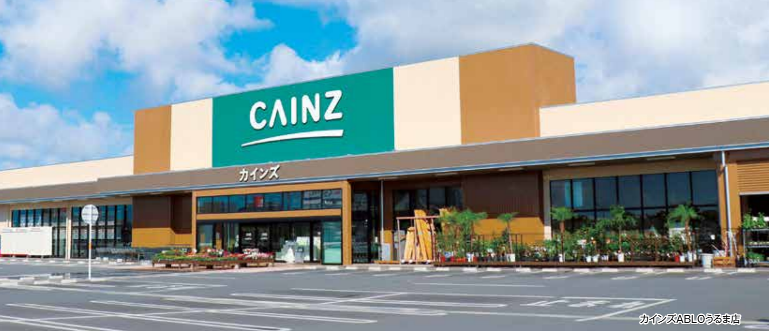
カインズABLOうるま店