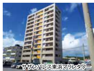
サザンパレス東浜マリントワー