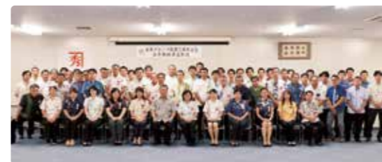
金秀グループ永年勤続表彰