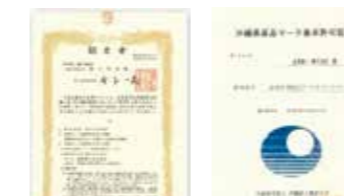
Hグレード大臣認定 県産品