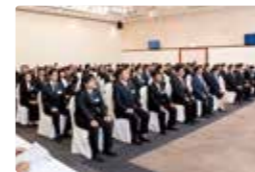
金秀グループ合同入社式