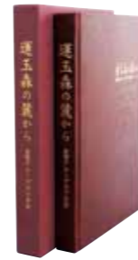
「運玉森の麓から」 金秀グループ 六十年史発刊