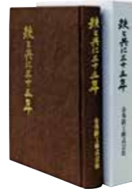
金秀鉄工 「鉄と共に三十五年」発刊