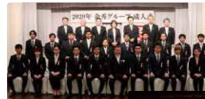
金秀グループ成人式