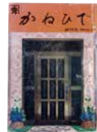
金秀グループ会報 「かねひで」創刊号