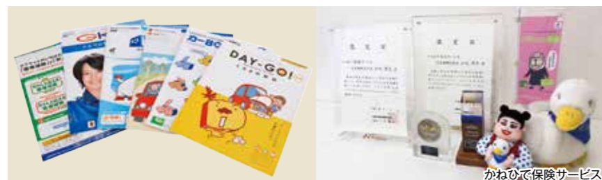
かねひで保険サービス