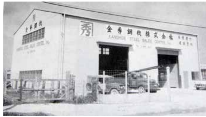
設立当時の金秀鋼材社屋