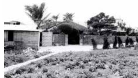
御殿下がりの生家