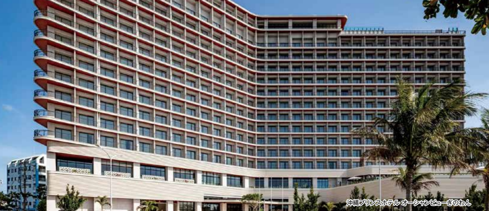
沖縄プリンスホテルオーシャンビューリゾートのわん