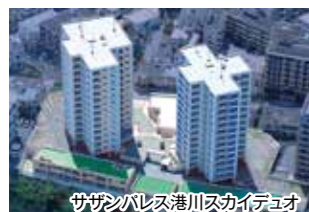
サザンパレス港川スカイデュー