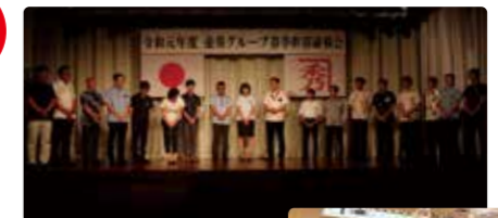
金秀グループ 幹部研修会 (春季・秋季開催)