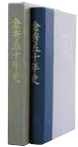
「金秀グループ 五十年史」 発刊