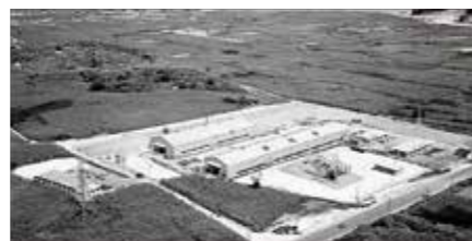
設立当時の沖縄軽金属(現 金秀アルミ工業株式会社)