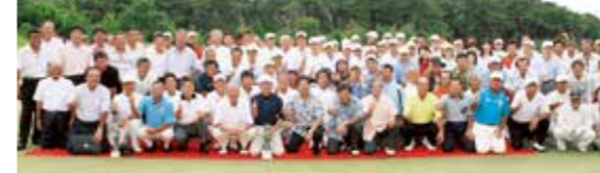
金秀シニア沖縄オープンゴルフトーナメント