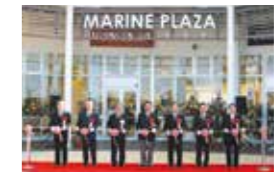
マリンプラザあがり浜