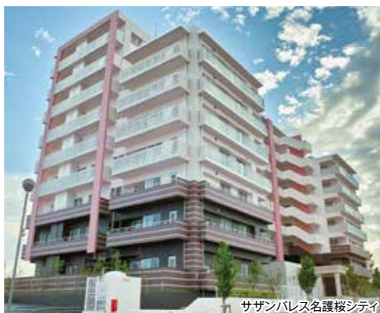
サザンパレス名護桜シティ