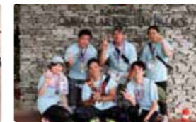
金秀グループ新入社員研修