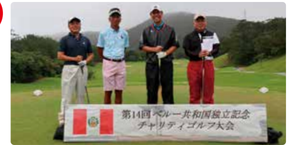
ペルー共和国独立記念チャリティゴルフ大会