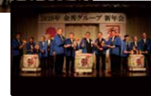
金秀グループ新年会