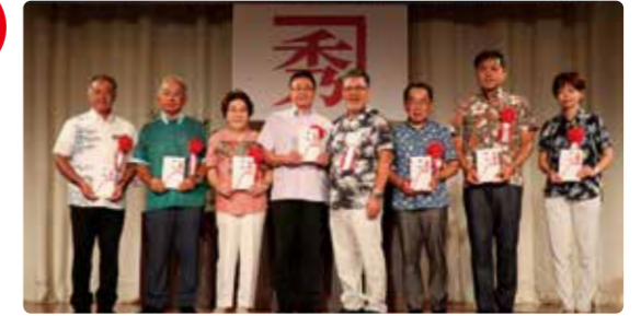
金秀グループ創業記念チャリティーゴルフ大会