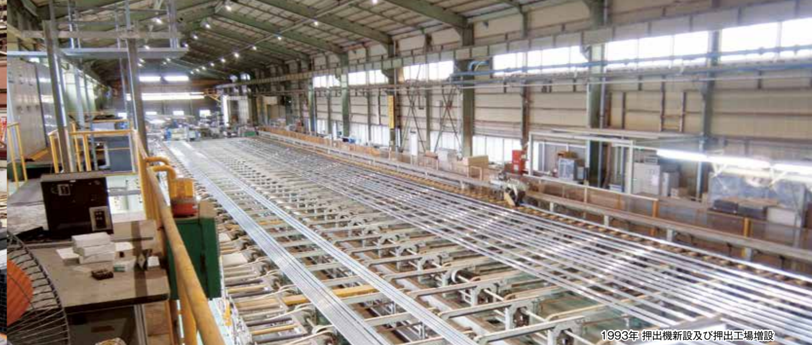
1993年 押出機新設及び押出工場増設