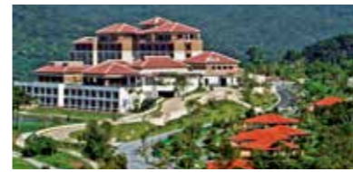
喜瀬別邸HOTEL&SPA(現ザ・リッツ・カールトン沖縄)