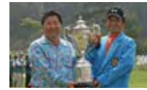
第75回日本プロゴルフ選手権 大会開催