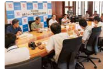
金秀グループ 連結決算発表