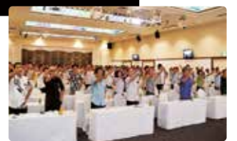
金秀グループ安全衛生大会