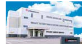
金秀商事株式会社新社屋完成