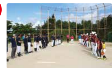
金秀グループ大運動会 ※2020年~2022年はソフトボール大会を実施