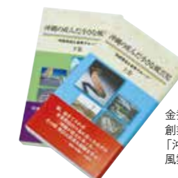
金秀グループ 創業65周年記念誌 「沖縄の産んだ小さな 風雲児(上下巻)」