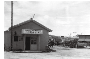
美田時代の金秀鉄工所 / 1950年